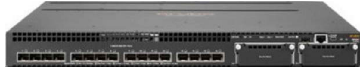
Switch Centro Stella