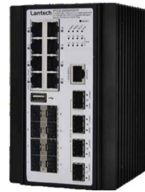
Switch Quadro di Concentrazione